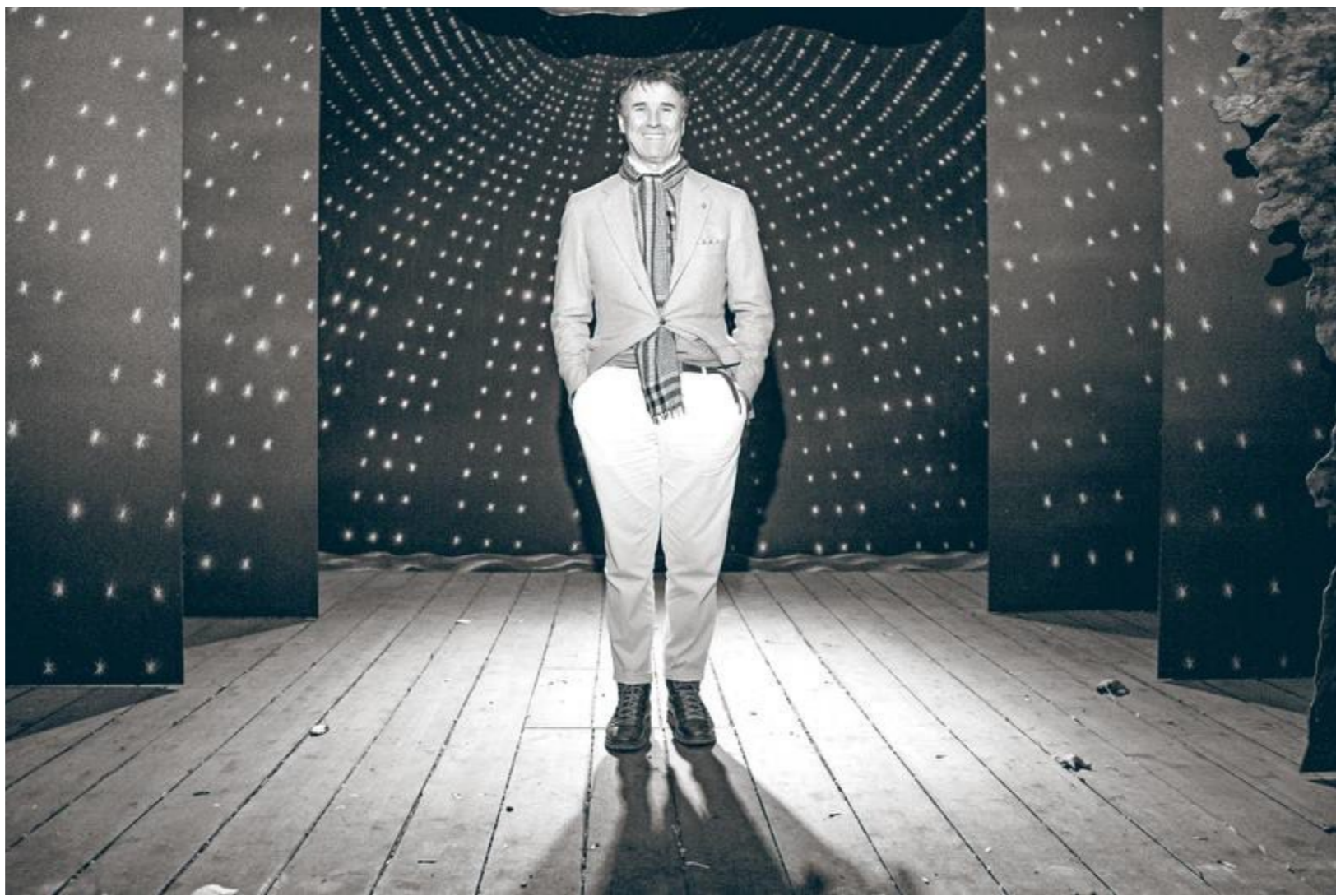
Ein Mann der Bühne: Brunello Cucinelli im Bühnenbild von Karl-Ernst Herrmann zu „Wienerlieder“ im Berliner Ensemble

Unter den Jungen ja. Seit 20 Jahren arbeite ich darauf hin, dass sich keiner schämt, Schneider zu sein. Deswegen unterhalten wir eigene Berufsschulen. Ich zahle dafür, dass die Leute da lernen, ohne Verpflichtung, nachher in Solomeo zu bleiben. Am Ende bekommen sie ein Zertifikat, damit können sie auch zu Giorgio Armani gehen und sagen, sie hätten ein Jahr bei Brunello verbracht. Schneider, Maurer, Gärtner werden be-