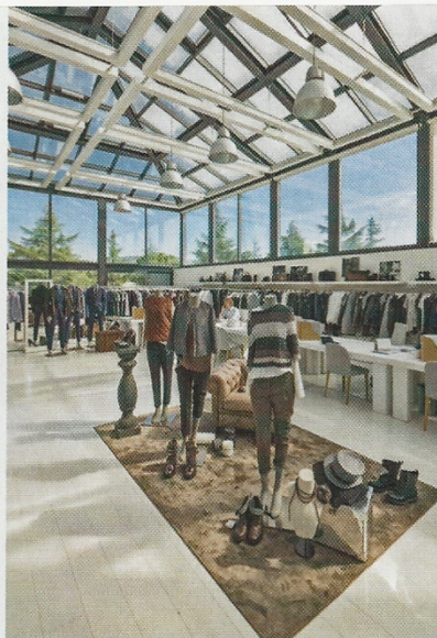
Si la ville de Solomeo possède ses ateliers de confection et showroom (ci-contre), elle renferme aussi un théâtre que Brunello Cucinelli a voulu construire en matériaux made in Italy (ci-dessous). Le bureau du styliste (à gauche) est un cabinet de curiosités. Buste de Sénèque, ballons, recueils de philosophies, et bobines de cachemire s'y côtoient.